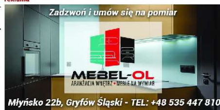
Młyńsko 22b, Gryfów Śląski - TEL: +48 535 447 810