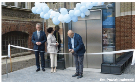
fol. Powiat Lwówecki

Gmina Wleń wspiera rozwój lokalnej służby zdrowia poprzez dofinansowanie budowy windy w szpitalu w Gryfowie Śląskim w kwocie 50.000 zł. Dzięki temu wsparciu, inwestycja o wartości blisko miliona złotych może zostać zrealizowa-