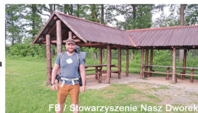
FB / Stowarzyszenie Nasz Dworek

Na swojej drodze spotkał serdecznych mieszkańców Dworka, którzy podzieliли się z nim posiłkiem i okazali życzliwość. Ta gościnność i jałmużna dodały mu sił i inspiracji, aby kontynuować swoją podróż. Życzymy powodzenia!