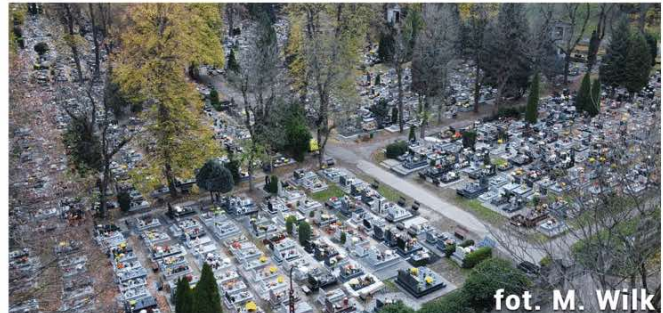
fol. M. Wilk

Na cmentarzu komunalnym w Lwówku Śląskim, 8 listopada miało miejsce nietypowe zdarzenie, które wymagało interwencji strażaków, policji i ratowników z Pogotowia Ratunkowego w Jeleniej Górze. Służby ratunkowe otrzymały wezwanie dotyczące niecodziennego zdarzenia, do którego doszło na terenie lwóweckiego cmentarza. Mundurowych poinformowano o 45-letniej kobiecie, która w skutek